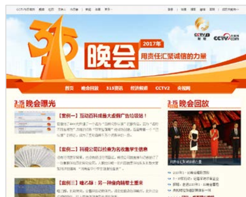
315 晚会の特設サイト http://315.cctv.com

毎年3月15日は「世界消費者権利デー」だ。日本では馴染みのない記念日だが、中国では毎年この日に中央電視台(CCTV)で「315 晚会」という特番が組まれる。政府機関と協力して“悪徳業者”をこっそり取材し、その悪行を暴き立てる内容だ。ターゲットとなったメーカーの不買運動が行われるのも恒例で、過去にはスターバックスやアップル、ソニー、ニコン等の外資系企業が非難的となっている。