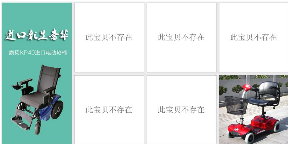
天猫のページはメンテナンスされていない様子 大慈運動专营店 https://dcyundong.tmall.com