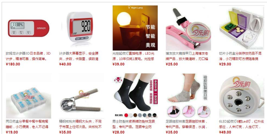
万歩計や爪切り、ピルケース、くるみ割り器なんでものもの