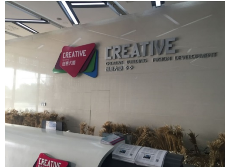
開発区のクリエイティブビル

21日の午後には、外資企業の出席者限定で濟寧国家ハイテク産業開発区の見学ツアーが生まれ、我々も参加してきた。同開発区は1992年春に開設され、2010年に国家レベルの重要拠点に格上げされている。区内には、光電情報産業基地、生物技術産業基地、工事機械産業基地、紡績新素材産業基地があり、ソフトウェア及びサービスアウトソーシング以外にも機器製造、バイオ医薬品、紡績、アパ