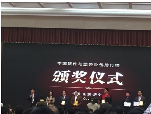
表彰された企業の代表ら

21 日午前に行われた講演では、ORACLE の OAEC 人材産業基地に関する説明や先進的な取り組みを行う全国のソフトウェア開発会社の例が紹介され、情報産業の発展が我々の経済や生活などに巨大な影響を及ぼす可能性について聞くことができた。併せて、過去 1 年で最もソフトウェア開発・アウトソーシング産業に貢献した企業への表彰式も行われた。